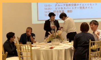
ビジネスチャンス拡大交流会