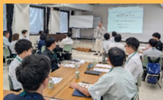
セミナー (人材育成・SNS活用等)