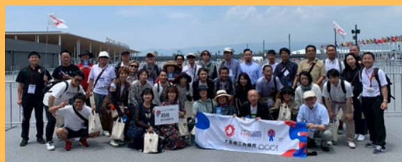
部会例会（大阪・関西万博視察）