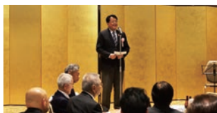
来賓を代表して内田市長によるあいさつ