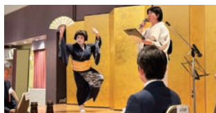
「正調岡崎五万石」をご披露いただきました