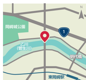
● 康生通南～明大寺町

(1927)に竣工した。ただ、人生劇場の「青春篇」が刊行されたのは昭和8年であるから、小説の中の殿橋は昭和の時代を共に過ごしてきた我らの仲間である。とは言え、来年には100歳を迎える。その間、昭和19年の昭和東南海地震、翌昭和20年の三河大地震、はたまた岡崎大空襲、幾多の台風などを経験したが、大した「病氣も怪我」もなく、ほぼ竣工した当時の姿のまま晴れて100歳を迎えるのだ。矢作橋の橋脚も崩壊したというから、これは本当にすごいことだろう。