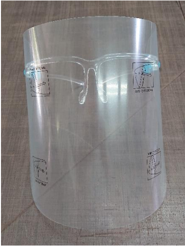
飛沫感染拡大予防グッズ