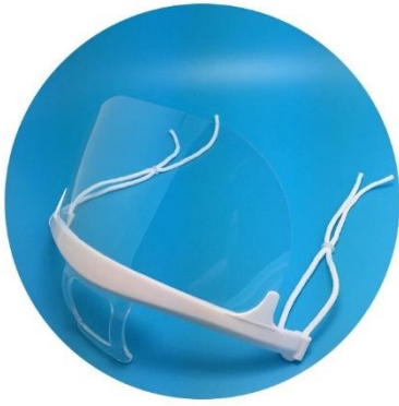
飛沫拡大予防グッズ