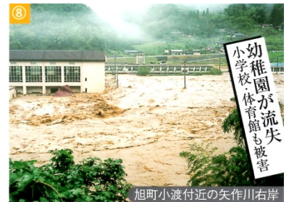
旭町小波付近の矢作川右岸