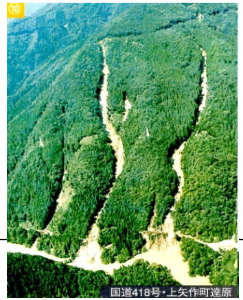
国道418号・上矢作町遠原