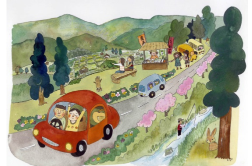
こんな美しい楽しい景観を作ります