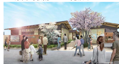
エキニシコマチ出入口イメージ