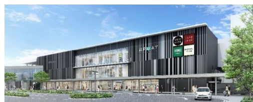
東岡崎駅南口ビル完成イメージ