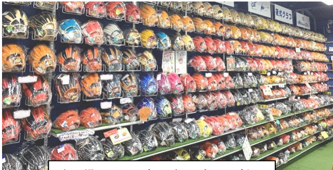
売り場には600個以上のグローブも

それまで野球経験の無かった同氏は、武器として「グローブの修理」技術を独自で磨き、これまで1万2000個以上のグローブを修理・型付けを行った結果、今では 県外からも「この店でグローブを買いたい！」 とお客様がいらっしゃるようになりました。そんな同店の絞り込み、振り切った経営戦略について学びます。ぜひご参加ください。