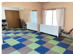
今回改装したトレーニングルーム

識を高めながらトレーニングすることが出来ます。また、1人で自主練する方の集中力アップのために防音扉をつけたことで「家よりも集中して取り組める」と好評です。