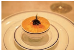
産地や部位の特徴を最大限に引き出した料理