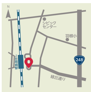
【JR岡崎駅】 ●羽根町 (JR岡崎駅 東口側)