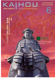
松平元康像 (JR岡崎駅)