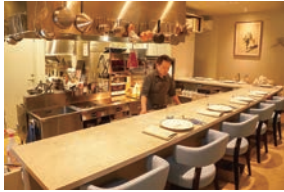
ライブ感のある カウンター席