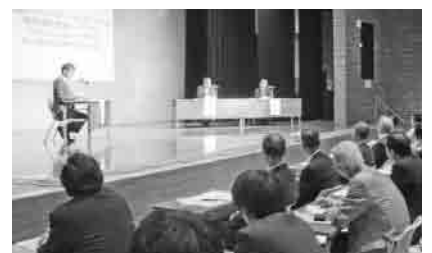
▲パネルディスカッションの様様