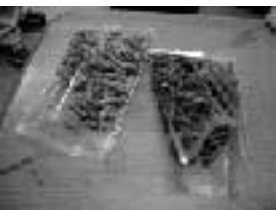
出来立てはサクサク 美味しい!

「出来立ての美味しさを味わって欲しい」との想いから始めた、店頭でのかりんとう量り売りが好評。2月上旬からスタートして、お客さんからの反応も上々とのこと。