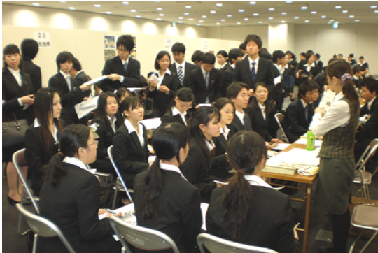
4/21 三河地区合同企業説明会 於 ウィンクあいち