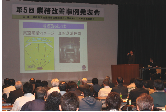
3/15 第5回業務改善事例発表会 於 本所大ホール