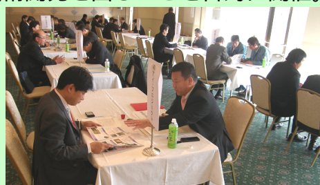
商談会の模様 於 岡崎ニューグランド ホテル