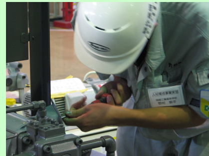
生徒実習風景の模様