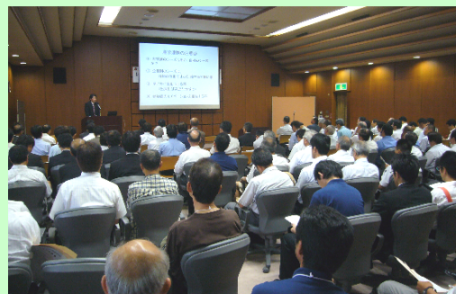
地域活性化をテーマに、今後期待される成長産業分野、新素材、技術開発について講演