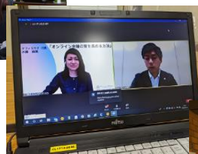
← オンラインセミナー 多数開催