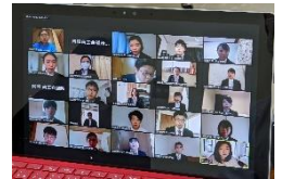
↑ 学生向け WEB セミナー