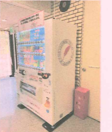
募金のできる自販機

会社の正面入口や打ち合わせスペース、社員食堂等に設置していただき、『いつでも、だれでも、簡単に募金ができる』自動販売機です。飲料水の売り上げの一部が寄付され、社会貢献活動ができる自販機を設置してみませんか？