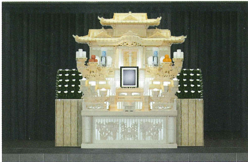
※ご利用の式場により祭壇の様子が異なる場合がございます。