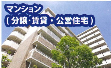
マンション (分譲・賃貸・公営住宅)

マンションなどの集合住宅は、ハトの被害が最も多い場所となります。マンションの外壁修繕などのタイミングで施工することにより、足場を組むコストが共有できますので、経済的に施工することができます。