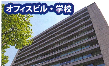
オフィスビル・学校

マンションなどの集合住宅は、ハトの被害が最も多い場所となります。マンションの外壁修繕などのタイミングで施工することにより、足場を組むコストが共有できますので、経済的に施工することができます。