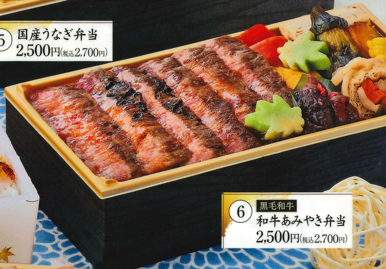
⑥ 黒毛和牛 和牛あみやき弁当 2,500円(税込2,700円)