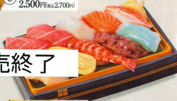
11 握り寿司(特) 2,500円(税込2,700円)