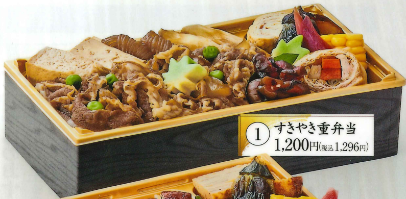
① すきやき重弁当 1,200円(税込1,296円)

6/17(水)より、 季節のおすすめ弁当が 新しく生まれ変わります。 季節ごとの味わいを是非お楽しみください。