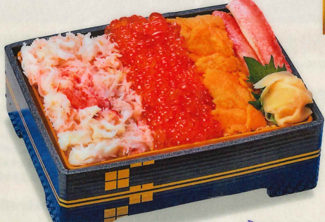
13 贅沢海鮮ちらし寿司 2,500円(税込2,700円)