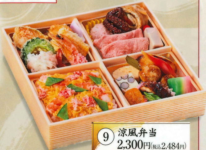
9 涼風弁当 2,300円(税込2,484円)