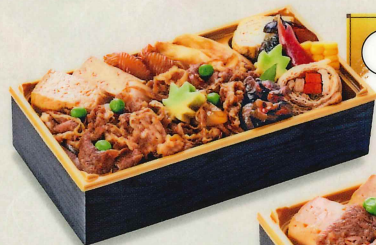
1 すき焼き重弁当 1,200円(税込1,296円)