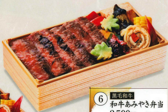
6 黒毛和牛 和牛あみ焼き弁当 2,500円(税込2,700円)