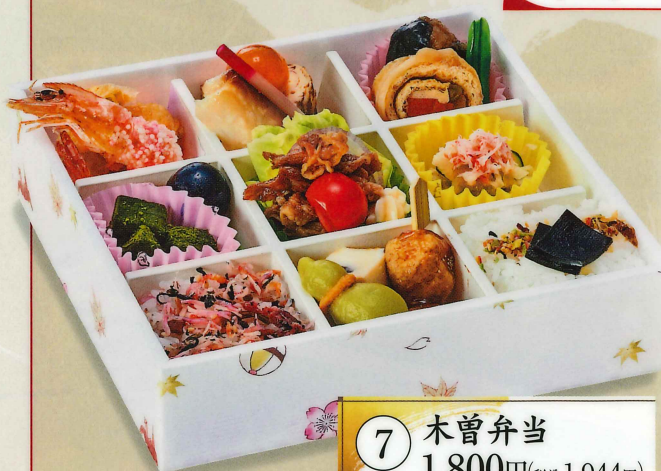
7 木曾弁当 1,800円(税込1,944円)