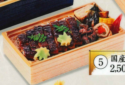
5 国産うなぎ弁当 2,500円(税込2,700円)