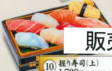
10 握り寿司(上) 1,700円(税込1,836円)