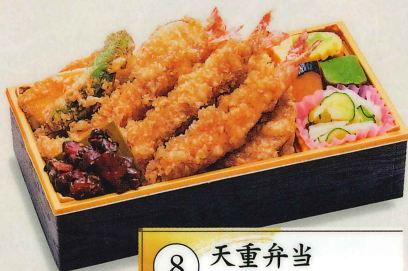
8 天重弁当 1,500円(税込1,620円)