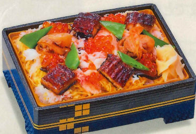
12 海鮮鰻ちらし寿司 1,700円(税込1,836円)