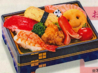
14 お子様寿司 800円(税込864円)