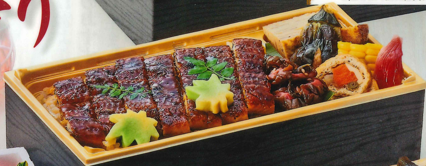
⑤ 国産うなぎ弁当 2,500円(税込2,700円)