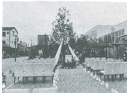
ララチャンスさんと協働したガーデンウエディング