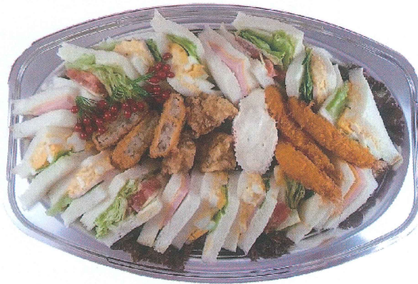
オードブルサンド ¥2,600～