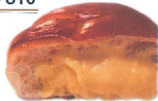
ふわとろクリームパン ¥160

ランチ・軽食・お土産に。サンドウィッチや人気のパンなど多数揃っています。 ご予算・数量など気になる点はお気軽にご相談ください。