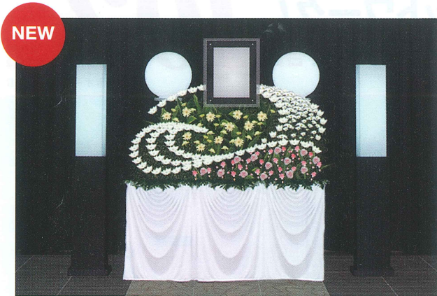
※この祭壇のお花は造花を使用しております。 ※下記の他にも宗派・予算によりお選びいただけます。