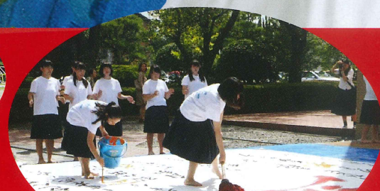
光ヶ丘女子高等学校書道部