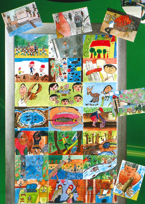
“大好き夏山!!” 岡崎市立夏山小学校全校児童作品