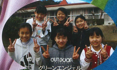
OUTDOOR グリーンエンジェル