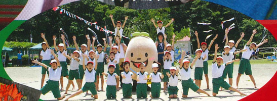
岡崎市立夏山小学校全校児童