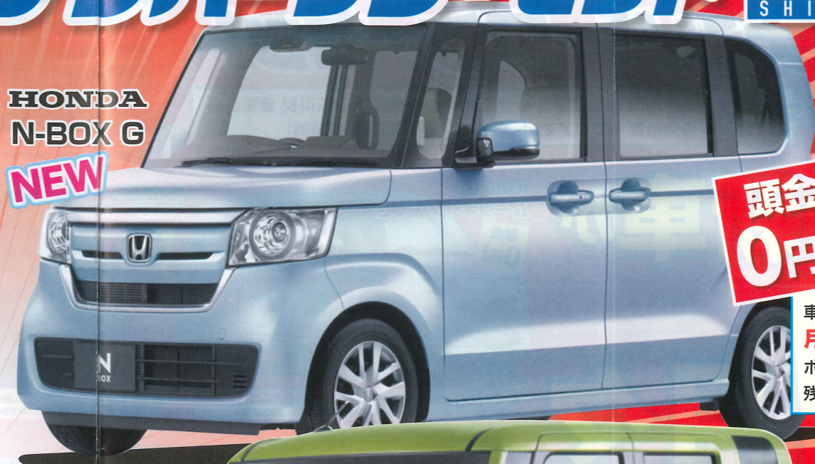
HONDA N-BOX G NEW