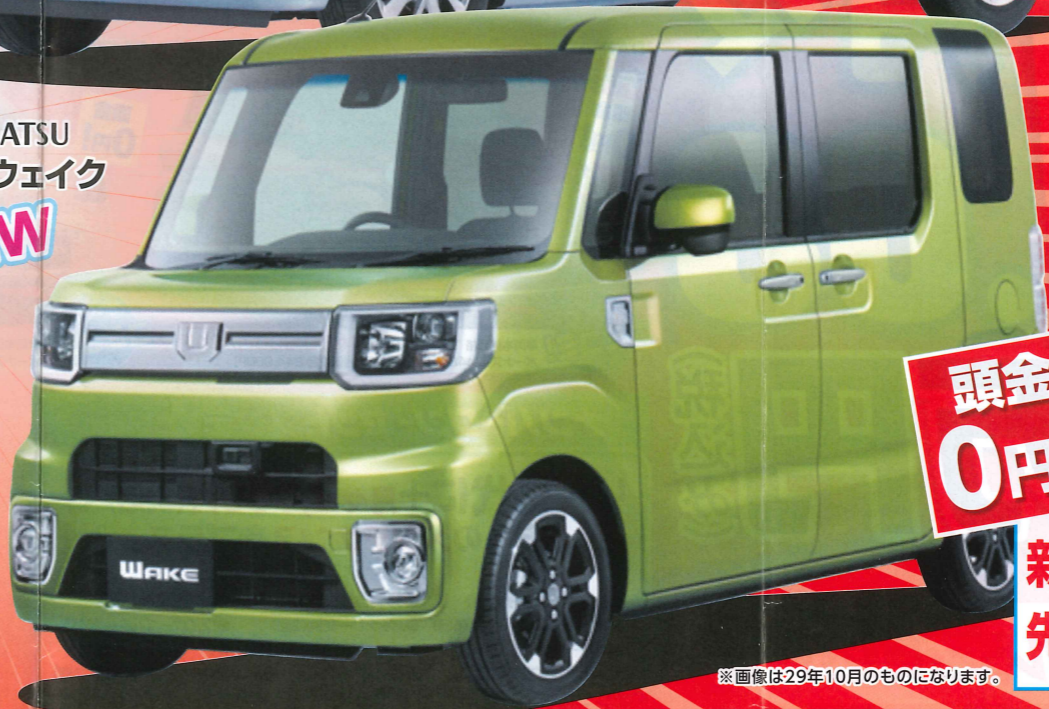
DAIHATSU 新型ウェイク NEW

車両本体価格 1,315,440円 月々10,800円×84回 ボーナス払い 60,480円×14回 残価設定 358,000円