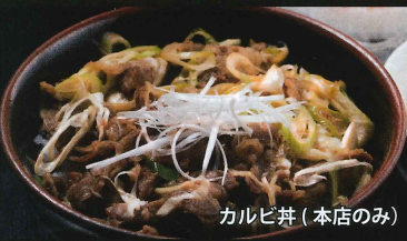
カルビ丼 (本店のみ)