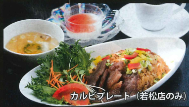
カルビプレート (若松店のみ)