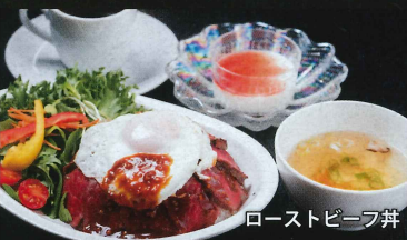
ローストビーフ丼