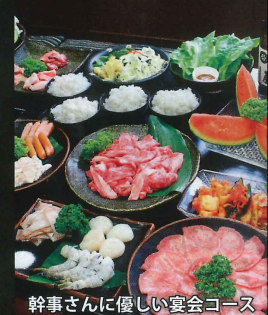
幹事さんに優しい宴会コース

大・中・小どんな宴会にも。 4名様から対応いたします。 各種宴会のご相談はお気軽にご連絡 ください。