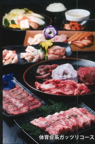
体育会系ガッツリコース