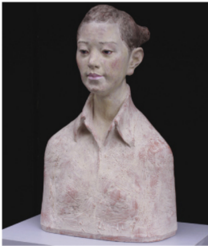
荒川 寧 「華・Ⅲ」