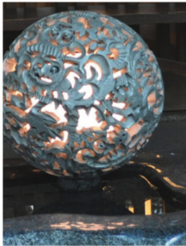
大野幾生「侘助」(部分)