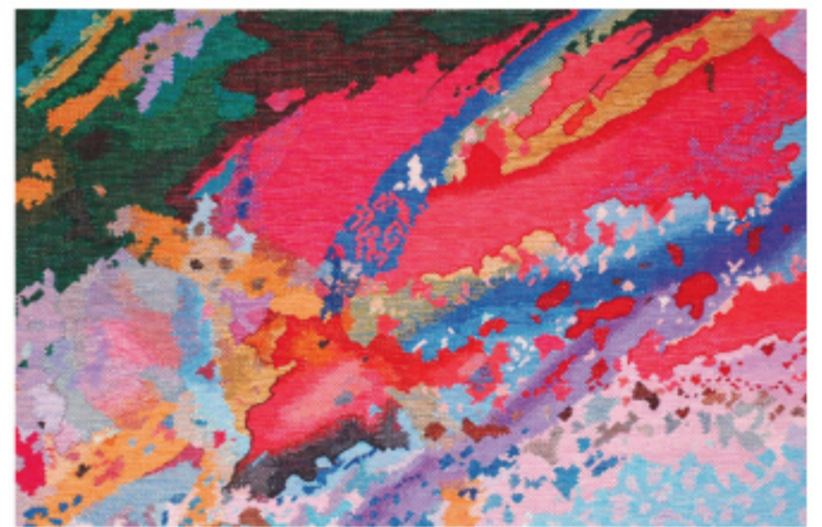
加藤國男 「Tabula rasaVI - 伝統の観智への回帰 -」