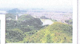
継鹿尾山山頂からの景色 (犬山城も見えるよ！)