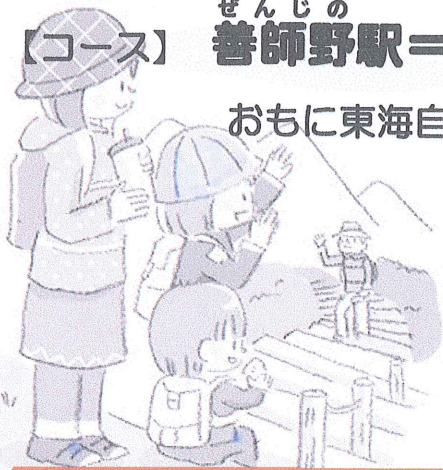
エメラルドグリーンの大洞池