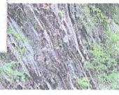
必見！犬山のチャート