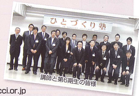
講師と第6期生の皆様

TEL：0564-53-6500 FAX：0564-53-0101 E-mail：kshibata@okazakicci.or.jp