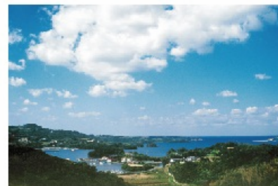
上村真珠養殖場 (長崎県志岐氏半城湾)

WAKANAはアコヤ真珠に通常使われている調色処理がされていません。厳選された真珠だけが持つ上質な美しさ、それがシチズン無調色パールWAKANAです。長崎県志岐にある国内屈指の養殖場、上村真珠が約2年間、丹精込めて養殖いたしました。 上村真珠は2006年、2007年、2008年と3年連続で、全国真珠品評会グランプリ、農林水産大臣賞を受賞いたしました。