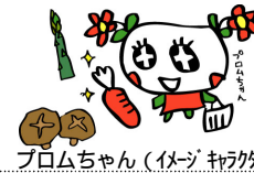
フロムちゃん(イマジキャラクター)