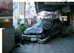
歩道に乗り上げた事故車

約半数の方が保存を希望していることがわかりました。50年近くアーケードとともに暮らしてきたわけですから納得できるような数字になりました。でも景観的には少し何となくというお声も聞かれています。6月4日の総会で「将来的に撤去して撤去する場合は撤去する」という方針でアーケード問題に対していくことに決められました。