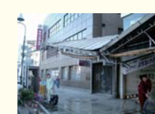
あとかたづけをする町内の方々