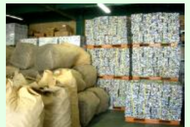
アルミ缶回収袋とプレスしたアルミブロック

また、ポイント還元することで、資源として再利用出来るということをお知らせするとともに「残留物がないよう水洗いして持参して下さい」ということをお願いしてきた結果、回収量の増加だけでなく、アルミ缶に含まれる不純物の割合が1%以下という質の高い状態を保っています。