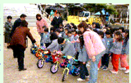
(岡崎市の明德保育園にて)

アルミ缶を売却した収益でお客様にはポイント制で商品として還元していますが、そのほかにも店舗所在地の自治体や社会福祉協議会にアルミ製車椅子121台、延べ500箇所以上の保育園・幼稚園に自転車や三輪車、乗用玩具など1800台を寄贈して来ました。その際リサイクルの意義を訴え、園便りなどに趣旨を掲載していただいています。