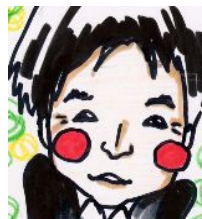
石田氏お気に入りの似顔絵です。