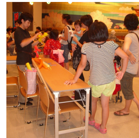
子供向け遊びコーナー （愛知学泉大学）

日時 平成22年7月31日（土）14時～20時 会場 竜美丘会館 大ホール 参加内容 子供向け遊びコーナー、バルーン・アート、八卦 （愛知学泉大学） 紙芝居・絵本（岡崎女子短期大学） 参加者 25名 来場者 1,500名