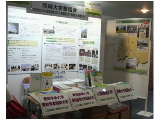
懇話会ブース （パネル展示、パンフレット配布）

日時 平成22年7月8日（木）9日（金）10時～17時 会場 竜美丘会館 大ホール 参加内容 岡崎大学懇話会構成大学の紹介 （パネル展示、パンフレット配布） 岡崎大学懇話会の活動紹介（パネル展示、チラシ配布） 来場者 4,559名