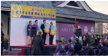
2024年大河ドラマ館 大津・宇治・越前の3市へバトンタッチ