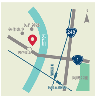
【勝蓮寺】 ●矢作町宝珠庵16 ●名鉄バス「矢作橋」から徒歩1分