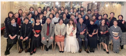
講師と星野バンドの皆様と一緒に♪

12月例会 イヤーエンドパーティ 12/6(水) 17:30～20:00 参加人数：37名 グランシェル岡崎(庄司田1丁目)