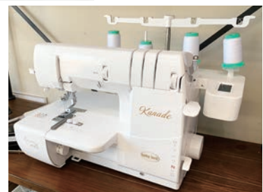
導入したカバーステッチミシン

取材時にロゴマークと社名を刺繍していただきました。マークと文字が段取り作業を入れて5分ほどで完成。