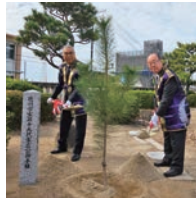
本所より大林会頭(右)と古澤顧問(左)が出席