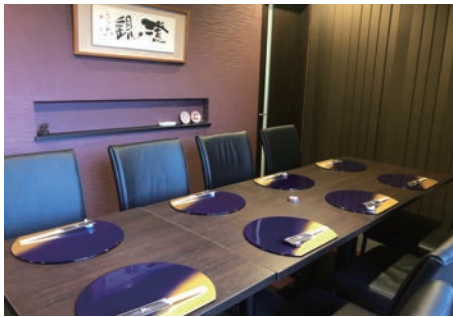
落ち着いた雰囲気の内はカウンター7席、テーブル席が3卓、ペアシートや完全個室(6~10人)が用意されています。