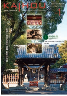
長瀬八幡宮 (森越町)