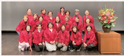
担当は理事会+研修委員会 お揃いのジャンパーで運賃！

11月例会 11/13(月) 18:30～20:00 岡崎市図書館交流プラザリぶら 参加人数：255名