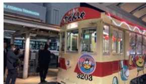
通常運行の合間に運行されるので、 時間厳守!