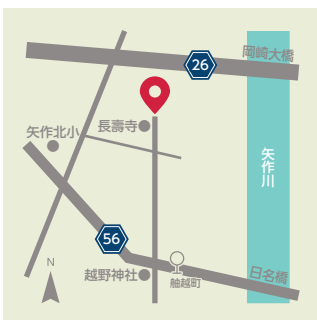
【長瀬八幡宮】 ●森越町字森下45 ●名鉄バス「舩越町」から徒歩8分