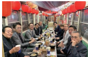
アツアツのおでんとビールで乾杯!