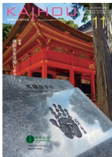
家康公手形(六所神社)