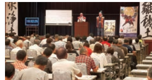
岡崎信用金庫本店 会場