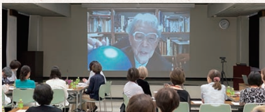
オンラインを活用し、北海道美瑛町より講演

9月例会 9/22(金) 13:30～16:00 岡崎商工会議所 2階 中ホール 参加人数：32名(オブザーバー参加含む)