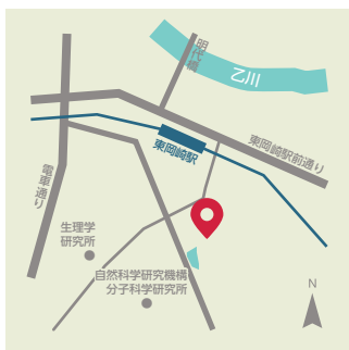
〔六所神社〕 ●明大寺町耳取44 ●名鉄東岡崎駅南口から徒歩2分