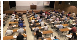
岡崎商工会議所 会場