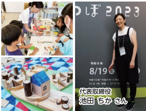
上) 自然素材を使って表現する造形教室やワークショップの様子 下) 木を使った子供たちの作品