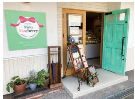
エメラルドグリーンが目印のかわいい外観