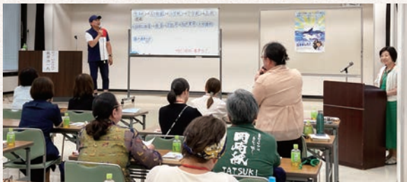
幼少期からの壮絶な体験も笑いに変え、胸に残るお話でした。

7月例会 7/3(日) 13:30~15:30 岡崎商工会議所 参加人数：29名(オブザーバー含む)