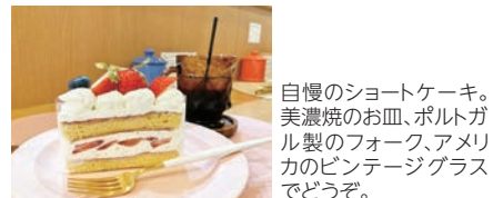
自慢のショートケーキ。美濃焼のお皿、ボルトガル製のフォーク、アメリカのビンテージグラスでどうぞ。