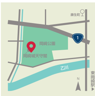
【岡崎公園】 ●康生町561-1 ●名鉄バス「康生町」から徒歩5分