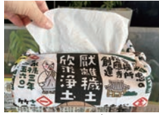
ティッシュカバーに