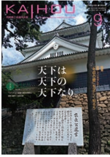
家康公遺言碑(岡崎公園)