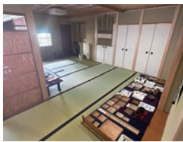
大人数の教室・講習会も可能です。