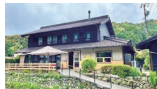
築70年の古民家を改装