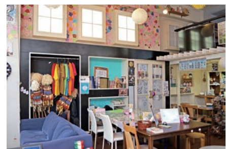
趣味を共有し合える場所