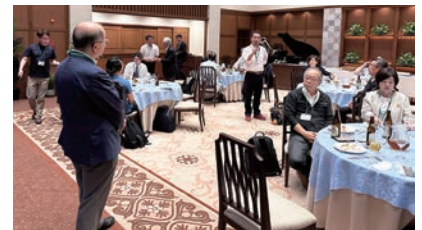
食事を囲んで振り返りや質問タイム