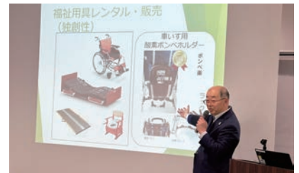
南部部会長のプレゼン