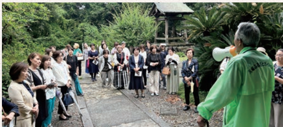
ボランティアガイドの案内により見学(清龍寺)

6月例会 浜松 大河ドラマ館&浜松・静岡女性会懇親会 6/9(金) 8:00～18:00 参加人数：30名