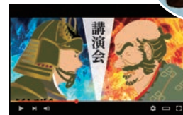
「徳川家康岡崎プロジェクト」特設サイトにて 最新シリーズ公開中