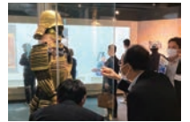
ドラマでも登場する 甲冑「金陀美具足」

来場者10万人を突破した岡崎大河ドラマ館をはじめ岡崎城や岡崎公園内の家康公ゆかりのスポットを見学しました。