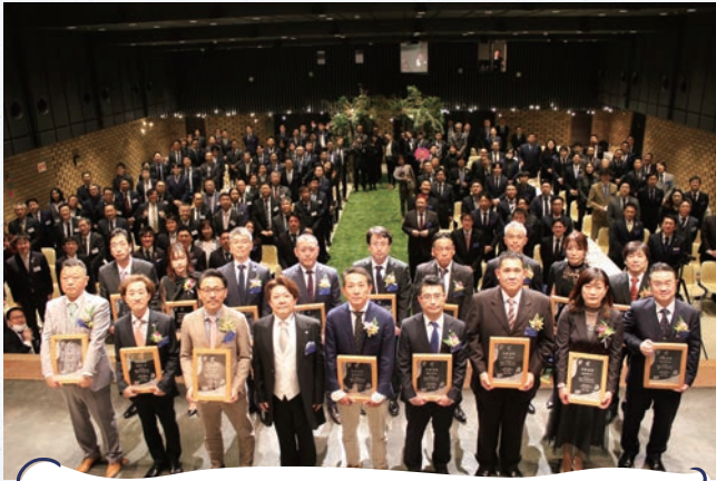
愛がいっぱい溢れる卒業式だったにゃ～(泣)

卒業生を送る会 ～愛と仲間と感謝とともに～ 3月9日(土) 岡崎商工会議所 大ホール 参加人数：198名 (卒業生17名、現役147名、OB34名)