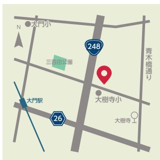
【大樹寺】 ● 鴨田町広元5-1 ● 名鉄バス「大樹寺」から徒歩7分