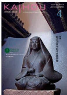
於大の方像(大樹寺)