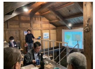
▲築130~140年の土蔵をリノベーションしたカフェにて