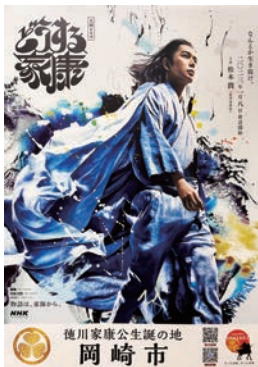
B1サイズ ※1店舗1枚のみ