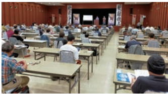
岡崎信用金庫本店