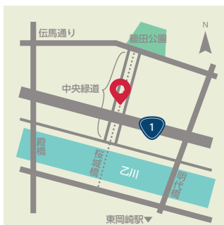
〔中央緑道 天下の道〕 ●岡崎市康生通南3 ●名鉄東岡崎駅から徒歩10分