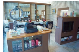
ゆったりとした店内は会話を楽しみながら過ごせます。

これまでにも、店舗の建替えやリフォーム時の経費按分、父の小規模企業共済の受取方法を相談した際、中長期的な視点でアドバイスをいただけて資金繰りや節税に役立ちました。特に後者は事業承継のタイミングだったので、非常にスムーズに承継できました。