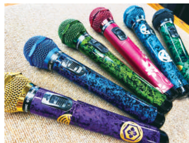
試行錯誤の末に完成したマイマイク