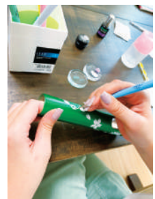
職人が全て手作業で製作