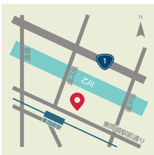
〔東岡崎駅ペDESTリアンデッキ〕 ●明大寺町2-17-1 ●名鉄東岡崎駅東改札口から徒歩1分