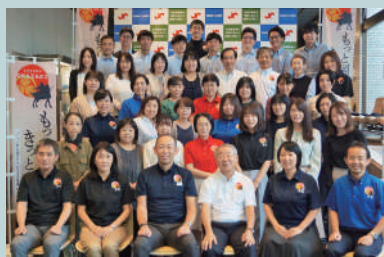
職員一同お待ちしております!