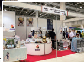
1ブースを6社が共有

地域の特産品や観光商品等の販路開拓・拡大支援を行うとともに、大河ドラマ「どうする家康」ゆかりの地を広く紹介できました。