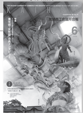
白木彫の昇龍 (龍城神社) 真達羅大将像 (鳳来寺/新城市)