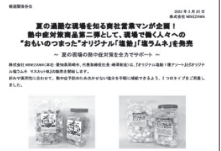
▲内容がひと目で分かる タイトルがポイントです。

何と言ってもまずは、記者の目に留まるタイトルです。パッと見ただけで“何が書かれているか”予測できる内容にしています。本文は、伝えたいポイントを絞りながら、データや数字を用いて客観的に書くようにしています。また、季節商品やキャンペーンの場合、早めに発信するなどタイミングも気にしています。最後に取材のチャンスを逃さないために担当者の連絡先を明記することも重要です。