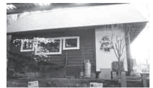
▲山小屋カフェ風の休憩・打合せスペース。自社製の看板で洒落た雰囲気です