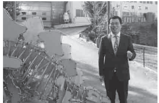
▲自社製の恐竜モニュメントと新美社長。夕方からは電飾で光ります

これからも“遊び心”を忘れず「鋳金屋のよろず相談」に応えるべく技術力向上に尽力します。