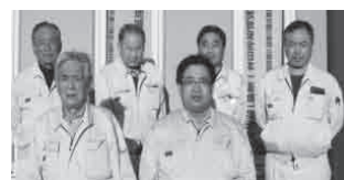
▲前列左から吉倉代表取締役、 吉倉取締役、従業員の皆様

ビジネス総合保険制度は、業務中の賠償・財物損壊リスクに備えられます。市街地での建設現場が多い当社にとって、通行人や隣接する建物などの第三者への補償があるこの制度は、万が一の事態に備えられるので助かります。また、従業員が安心して働ける職場づくりのため、業務災害補償プランで労災保険の上乗せをしています。