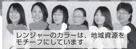
レンジャーのカラーは、地域資源をモチーフにしています

お客様の「こうしたい!」を形にするお助け隊として ~Vol. 5~ 結成した女性職員6人組が、「笑顔のタネ」をお届けします!