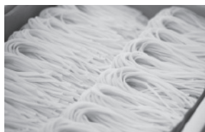
▲自社ブランド「金の麦」白黒写真でとても綺麗な黄金色がお見せできないのが残念です