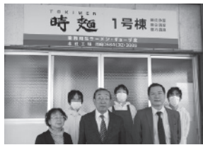
▲前列左から栗山専務、栗山社長、畑中執行役員、製造部門の社員様

今後も弊社の経営理念「商品を作る会社」から「サービスを作る会社」へと成長するため、森コーディネータから教わった原価も意識しながら商品開発に力を入れていきます。