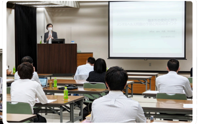
[メンタルヘルスセミナー]