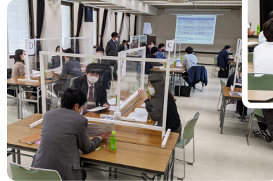
[人材育成セミナー]

『法改正による注意点』や『採用のトレンド』など、内容をしっかりと把握できるだけでなく、ワーク等を通じて、他社での事例や課題への対応方法など知ることができるので、自社の業務に活かします。